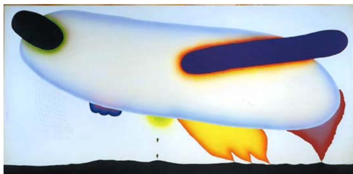
元永定正, ZZZZZ, 1971, 京都国立近代美術館蔵(本展展示)

思い立ったときに見たい作品が見られる。美術館や博物館の常設展示の魅力である。学校の図画工作・美術の授業と関連付けて活用できると、生涯付き合えるような作品が見つかるかもしれない。美術館・博物館の常設展示は、その館の持てる力を示す重要な展示であり、従来、美術・博物館では専門の学芸員の手により企画運営されてきた。